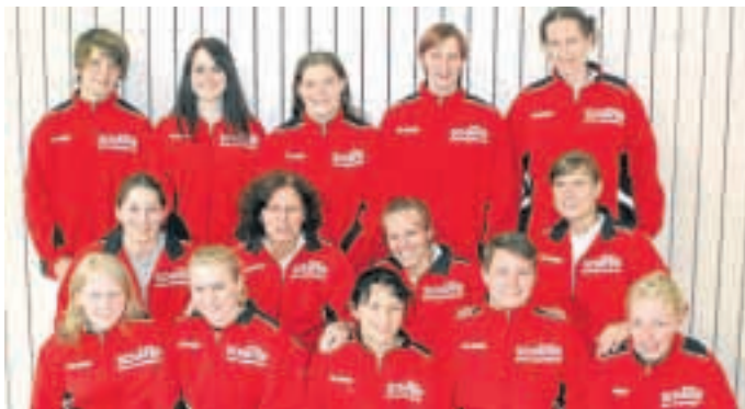
Sensationeller Bayernliga-Meister wurden die Judo-Frauen des 1. SC Gröbenzell.

Am letzten Kampftag stand man mit Obernburg und Passau gleich zwei starken Mannschaften gegenüber. Aber die Gröbenzeller konnten trotz Ausfällen an die erfolgreichen ersten Kampftage anknüpfen und wiesen Obernburg mit 8:2 mehr als deutlich in die Schranken. Gegen Passau kassierten die Gröbenzeller die erste Saisonniederlage. Weil aber auch Titelkonkurrent Grafing im letzten Kampf gepatzt hatte, waren die Gröbenzeller, trotz Niederlage, Meister. Für die Bayernliga