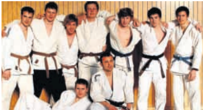
Erstmals seit mehreren Jahren konnte die Judo-Abteilung wieder eine Männermannschaft in der Bezirksliga stellen.